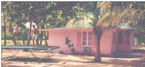
HOS MICK: Hva var ikke mer naturlig enn å hoppe på trampolinen til Mick Jagger når de først var på paradisyøya Mustique.

jeg fant et enkelt og litt shabby sykehus. Der skal jeg ikke opereres tenkte jeg. så jeg gikk ut av sykesenga og hoppet ut av vinduet, sier han.